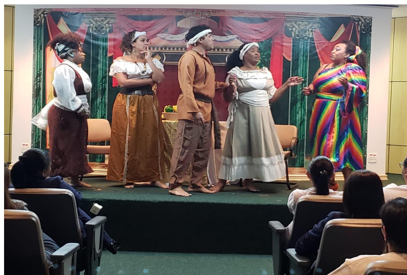
Fig. 3 – Espetáculo “Quem disse Clarice?”

Método: O grupo é formado por colaboradores que demonstrem interesse em participar, é dirigido pelo coordenador de Hospitalidade. Os ensaios são realizados no auditório do Instituto, uma vez por semana. O grupo é responsável pela elaboração do texto amparados pelas áreas técnicas do Instituto. Os temas são decididos e definidos pela necessidade do hospital, sendo validado pelo setor de Desenvolvimento de Pessoas. O grupo realiza uma peça por semestre e contribui com os treinamentos vigentes e com as ações institucionais. Tem também como função colaborar com datas comemorativas.