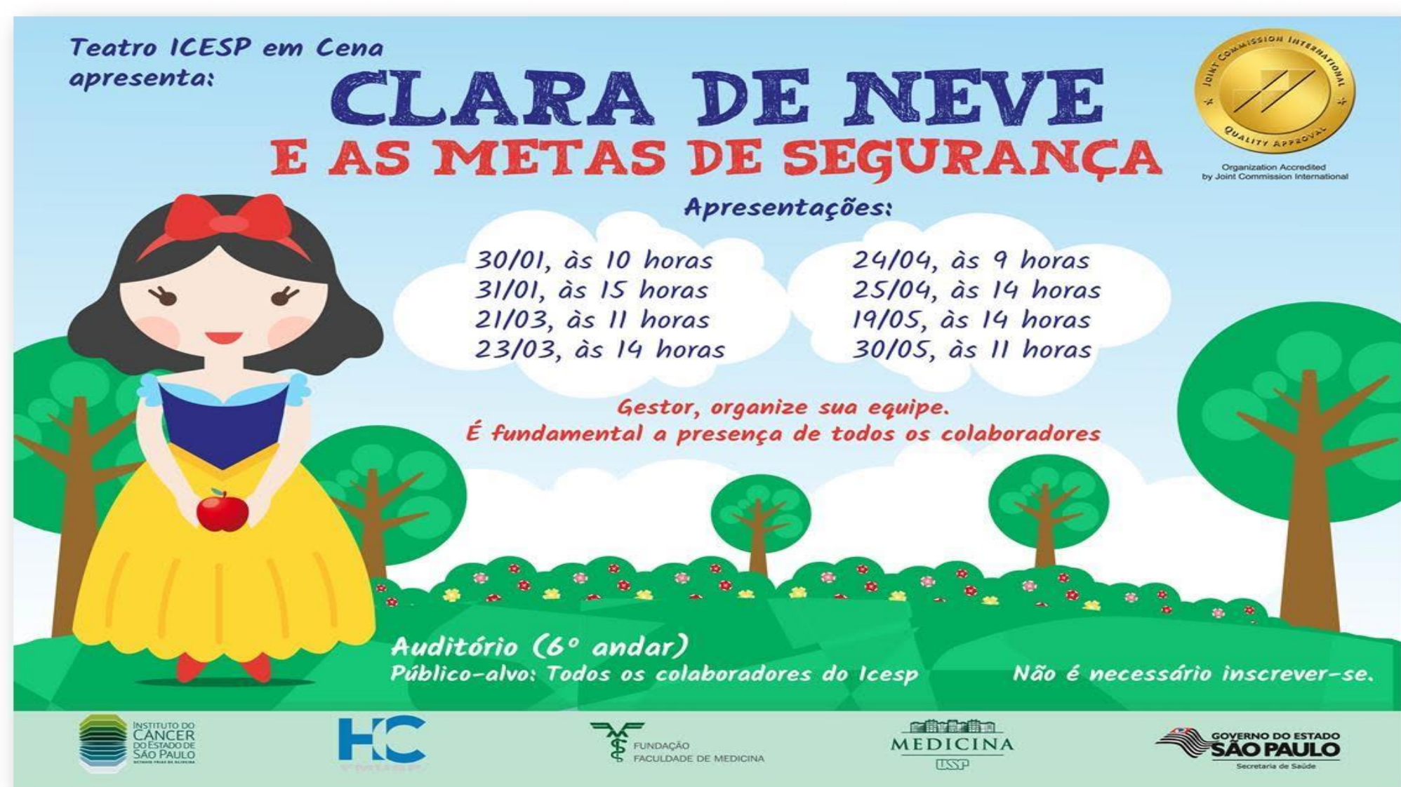
Fig. 1 - Cartaz de divulgação

Palavras chaves: cultura, treinamento, ludicidade, corporativo, Sensibilização institucional