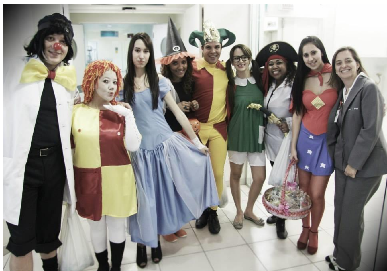
Fig. 2 – Ação Dia do Sorriso para os pacientes

Introdução: O núcleo de teatro: ICESP EM CENA, foi criado em 2011, objetivando ser um recurso institucional de disseminação de informações corporativas, visão e valores de forma lúdica. Apoiado pela alta direção, tem contribuído na Humanização e melhoria da comunicação inter e intrapessoal, sensibilizando os colaboradores.