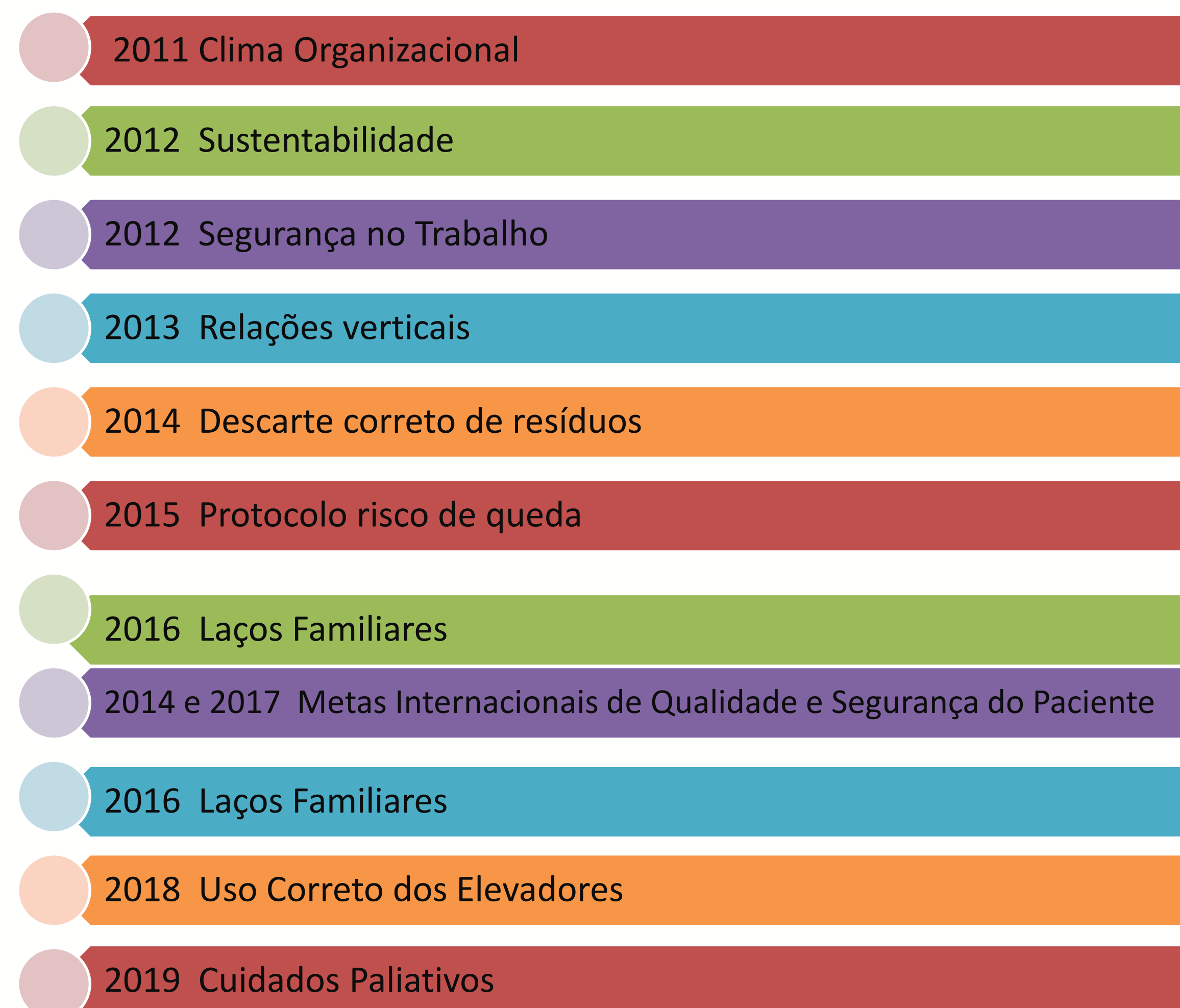
Fig. 4 – Linha do tempo com temas já abordados

As apresentações tem uma média de 170 espectadores por evento. Cada peça é avaliada e periodicamente realizamos uma avaliação geral sobre o desempenho do Núcleo de teatro. Abaixo dois resultados quantitativos: