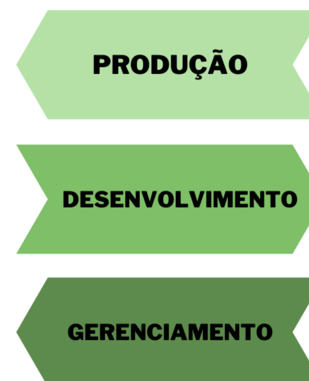
Figura 2- Etapas da criação de treinamentos online

Seu público alvo são colaboradores, especialistas da área médica, técnica, multiprofissional, terceiros e profissionais externos que prestam serviços em saúde.