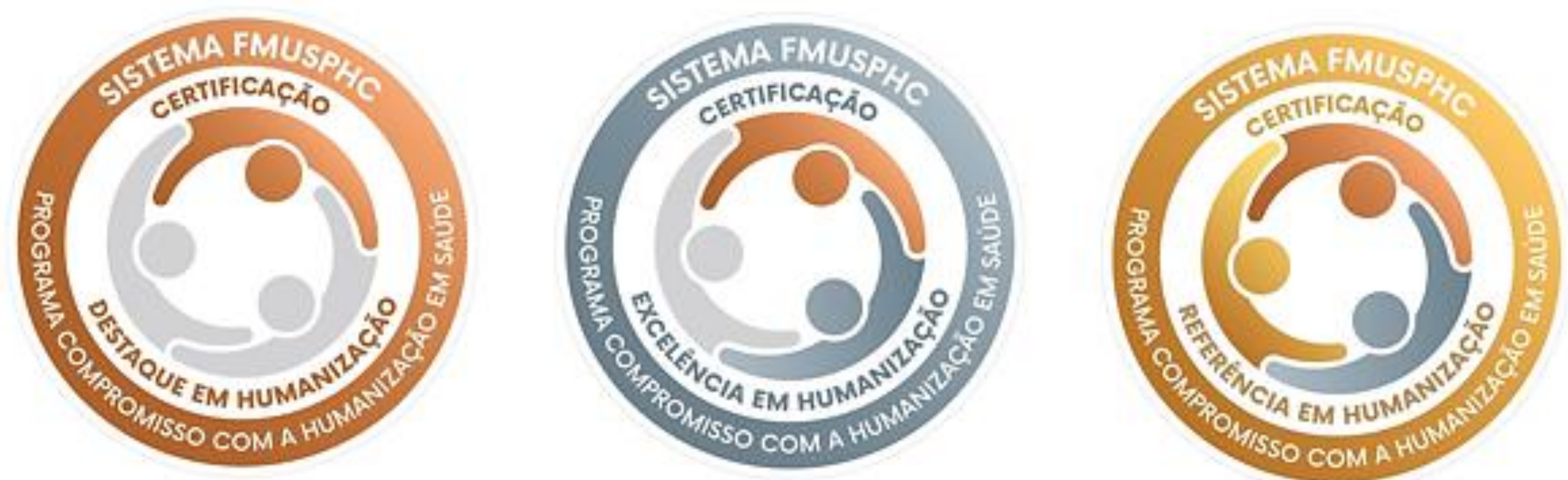
Quadro 2: Selos do Programa de Certificação de Compromisso com a Humanização.