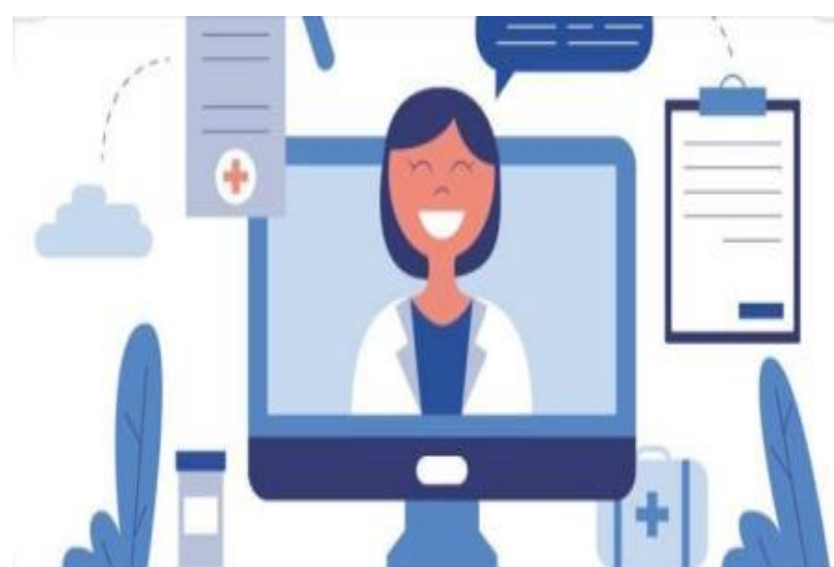
PRESENÇA DE REGISTRO DO MODELO ASSISTENCIAL NO PRONTUARIO ELETRÔNICO DO PACIENTE